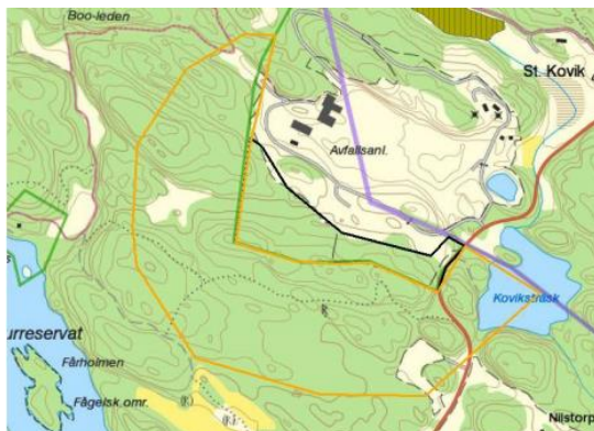
Fig 2. Karta som där det område som naturvärdesinventerats är markerat med en ljusbrun linje.

En naturvärdesbedömning genomfördes hösten 2017 varav en del av Koviksträskets strand ingick i inventeringsområdet. Själva sjön ingick inte i inventeringsområdet och om det finns groddjur eller salamandrar är således inte känt. Dock görs bedömningen att dessa inte skulle ta skada av Frentabs verksamhet, det vill säga utsläpp av låga kvävehalter till Koviksträsk.